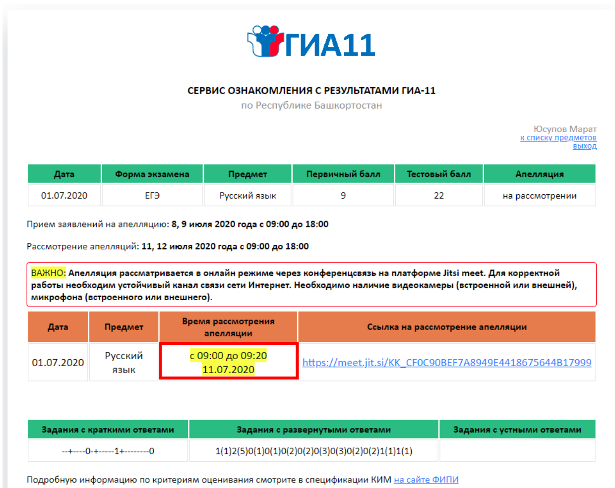
Рисунок 4. Страница «Ваши результаты ЕГЭ» с информацией о времени рассмотрения апелляции с ссылкой на комнату видеоконференции

Подача и рассмотрение апелляции о несогласии с выставленными баллами проводится в онлайн режиме.